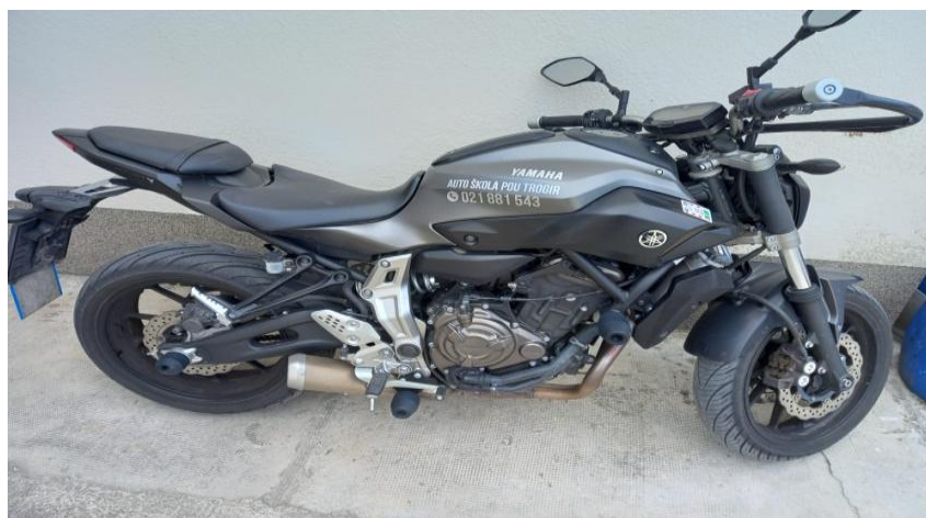
(Motor POU-Trogir Yamaha MT-07)

Ako motocikl pokreće motor s unutarnjim izgaranjem, radni obujam motora mora iznositi najmanje 395 cm. Ako motor pokreće električni motor, omjer snage i mase vozila mora biti najmanje 0,15 kw/k.