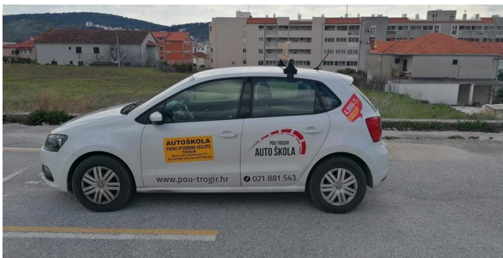
VW POLO 1.2 TSI

Za kategoriju B osobni automobil mora imati zvučne signale na udvojenim komandama koji može razviti brzinu od najmanje 100 km/h te mora biti opremljen ABS sustavom kočenja. Automobili koji nisu opremljeni ABS sustavom kočenja, a koji su se koristili za provedbu ispita do stupanja na snagu ovog programa mogu se i dalje koristiti do isteka propisanih godina starosti.